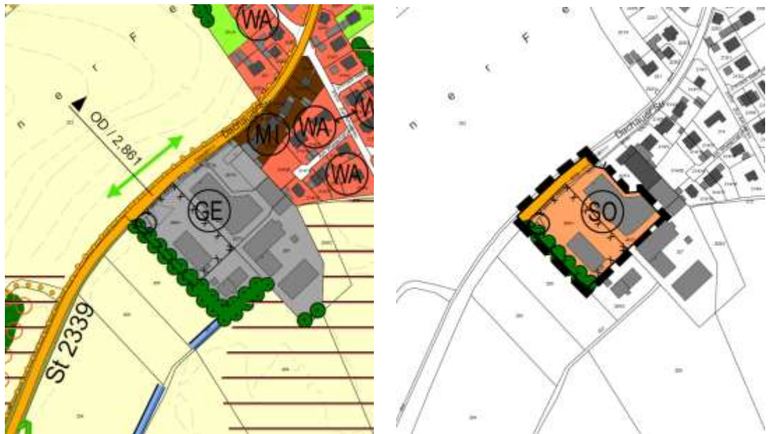
Abb. 5: Ausschnitt rechtswirksamer Flächennutzungsplan gemäß 13. Änderung (links) und gegenständlicher 17. Änderung, ohne Maßstab

Die verkehrliche und technische Erschließung (Straße, ÖPNV, Wasserversorgung, Abwasser- und Abfallentsorgung sowie leitungsgebundene Energie und Telekommunikationslinien) erfolgt über die Dachauer Straße im Norden. Die vorhandene Transformatorstation wird auf Ebene des Bebauungsplans gesichert.