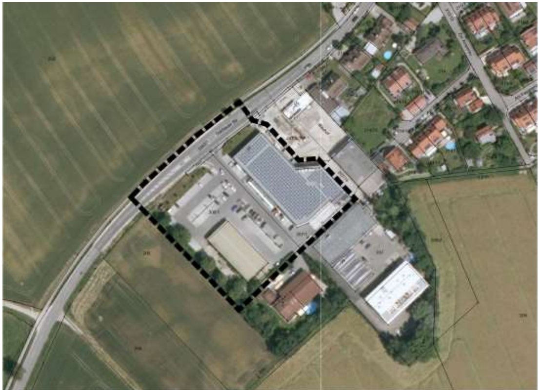
Abb. 1 Plangebiet, ohne Maßstab, Stand 17.01.2018

Im Umkreis zum Plangebiet ist kein Betriebsbereich gemäß § 3 Nr. 5a BImSchG vorhanden. Insofern sind gemäß § 50 BImSchG hervorgerufene Auswirkungen aufgrund von schweren Unfällen im Sinne des Artikels 3 Nummer 13 der Richtlinie 2012/18/EU in Betriebsbereichen auf benachbarte Schutzobjekte gemäß § 3 Abs. 5d BImSchG nicht zu erwarten.