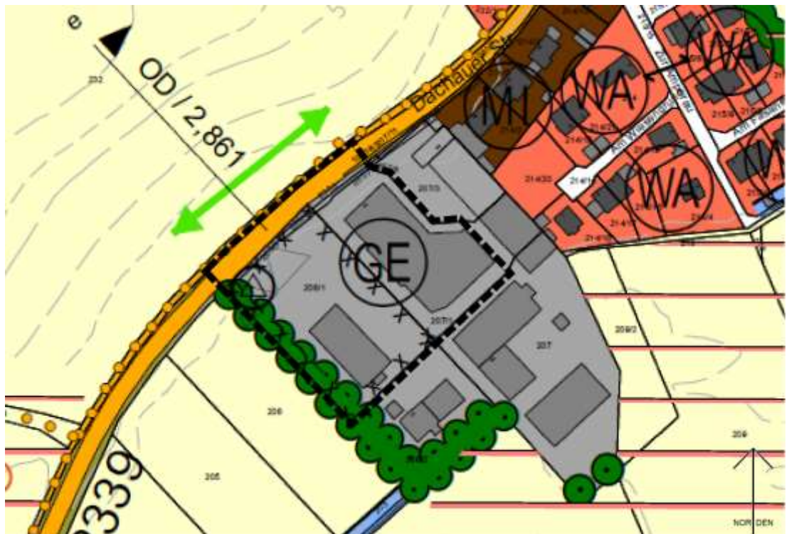
Abb. 4 Ausschnitt aus dem wirksamen FNP (13. Änd.) mit Änderungsbereich der 17. Änderung, ohne Maßstab

Im Rahmen des Bauleitplanverfahrens wird der Bebauungsplan im Parallelverfahren geändert. Die Bebauungsplanänderung erfolgt im beschleunigten Verfahren gemäß § 13a BauGB.