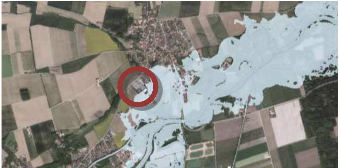
Abb. 2: Hochwassergefahrenflächen HQ extrem, ohne Maßstab

Im Plangebiet befinden sich keine arten- oder naturschutzrechtlichen Schutzgebiete. Entlang der Amper befinden sich in ca. 450 m Entfernung (Luftlinie) mehrere Schutzgebiete (Fauna-Flora-Habitat-Gebiet, Landschaftsschutzgebiet, mehrere Biotop). Von einer Betroffenheit durch das Vorhaben wird jedoch nicht ausgegangen. Darüber hinaus beginnt südlich des Plangebiets in ca. 50 m Entfernung (Luftlinie) eine im Jahr 2013 ermittelte Hochwassergefahrenfläche HQ extrem der Amper.