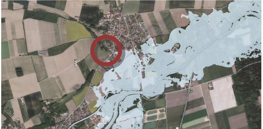
Abb. 5: Hochwassergefahrenflächen HQ_{\text{extrem}}, ohne Maßstab, Stand 15.02.2019

In einer Entfernung von ca. 670 m (Luftlinie) südlich befindet sich die Amper. Entlang des Flussverlaufs beginnt im Südosten ca. 130 m Entfernung (Luftlinie) eine im Jahr 2013 ermittelte Hochwassergefahrenfläche HQ_{\text{extrem}} der Amper. Das Plangebiet selbst ist davon nicht betroffen. Es wird angenommen, dass das Grundwasser voraussichtlich mit Hochwasserereignissen korrespondiert. Daher ist davon auszugehen, dass bei extremen Hochwasserereignissen mit einem Anstieg des Grundwassers bis nahe Geländeoberfläche zu rechnen ist.