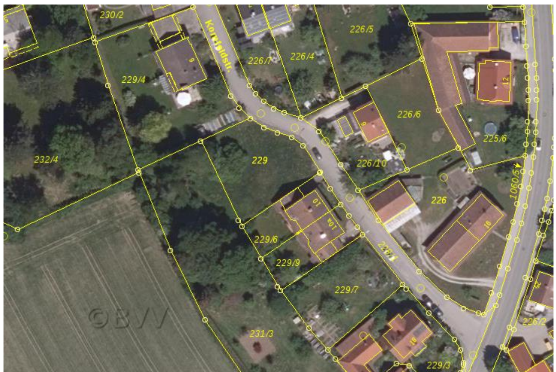
Abb. 3 Luftbild des Plangebiets, ohne Maßstab, Stand 27.08.2019

Das Plangebiet ist relativ eben und weist eine Höhe von ca. 473 m ü NHN ab.