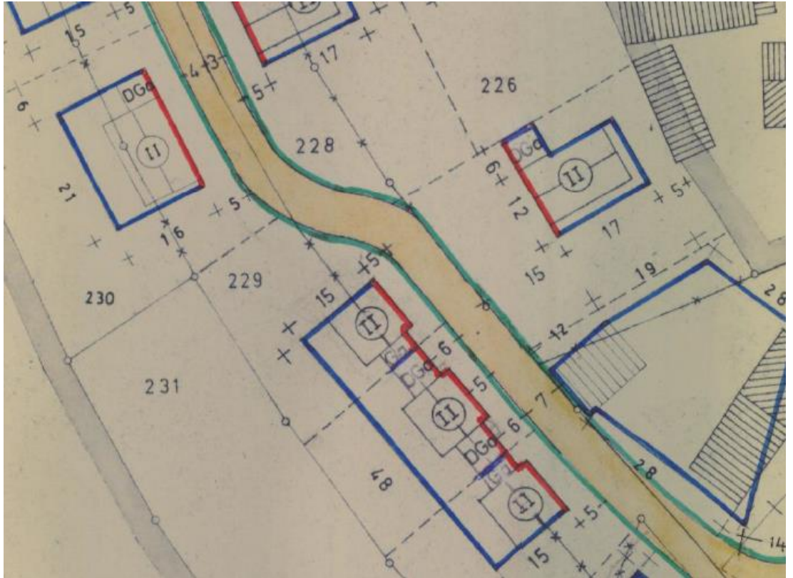
Abb. 2 Ausschnitt der Planzeichnung des rechtsverbindlichen Bebauungsplans „Ampermoching West 1“, genehmigt am 16.04.1969, ohne Maßstab

Für den südlichen Teil des betroffenen Grundstücks ist ein Baufenster festgesetzt, wobei entlang der öffentlichen Straßenverkehrsfläche eine Baulinie – mit einer zurückversetzten Garage – für die Bebauung vorgesehen ist. Ein Abstand von 5 m zur Straße ist vorgesehen, eine Bebauung von 15 m Tiefe ist zulässig.