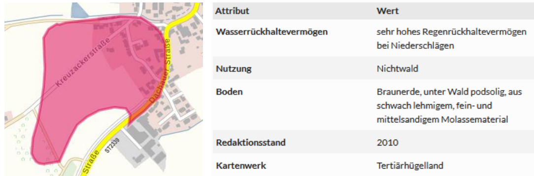
Abb. 4: Wasserretentionsvermögen, ohne Maßstab

Gemäß der Karte Wasserretentionsvermögen des Bayerischen Landesamts für Umwelt liegt das Plangebiet auf Braunerde-Böden aus schwach lehmigem, fein- und mittelsandigem Molassematerial. Das Wasserrückhaltevermögen bei Niederschlägen wird als sehr hoch bewertet.