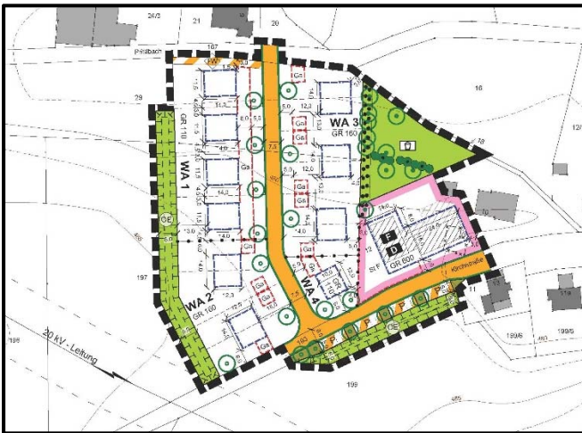
Ausschnitt Planzeichnung Bebauungsplan

Der Bauausschuss der Gemeinde Hebertshausen hat in seiner Sitzung vom 17.03.2020 die vom Planungsverband Äußerer Wirtschaftsraum München aufgestellten Entwürfe der 16. Flächennutzungsplanänderung sowie des Bebauungsplans „Prittlbach - Dorfgemeinschaftshaus“ gebilligt und den frühzeitigen Auslegungsbeschluss gefasst. Die Bauleitplanverfahren werden im Parallelverfahren gemäß § 8 Abs. 3 BauGB im Regelverfahren durchgeführt.