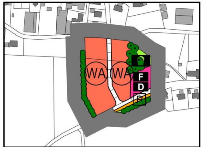
Ausschnitt Planzeichnung Flächennutzungsplan

Die frühzeitige Beteiligung der Behörden (gem. § 4 Abs. 1 BauGB) sowie der Öffentlichkeit (gem. § 3 Abs. 1 BauGB) an dieser Bauleitplanung findet in der Zeit vom 27.03.2020 bis 30.04.2020 statt. Die Planunterlagen für die 16. Flächennutzungsplanänderung (Satzung, Begründung und Umweltbericht) und für den Bebauungsplan „Prittlbach - Dorfgemeinschaftshaus“ (Satzung, Planzeichnung, Begründung und Umweltbericht) jeweils in der Fassung vom 17.03.2020 sowie eine Baugrunderkundung des Institut für Umwelt und Boden Bericht Nr. 220055 vom 03.03.2020 liegen im Bauamt der Gemeinde Hebertshausen, Am Weinberg 1, 85241 Hebertshausen während der allgemeinen Dienststunden öffentlich aus. Ein barrierefreier Zugang ist gegeben. Auf Grund der besonderen Lage (Corona-Virus) sind auch Terminvereinbarungen zur Einsichtnahme möglich.